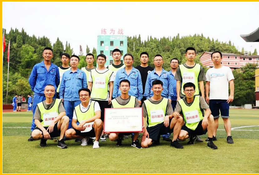
达兴能源退役军人风采