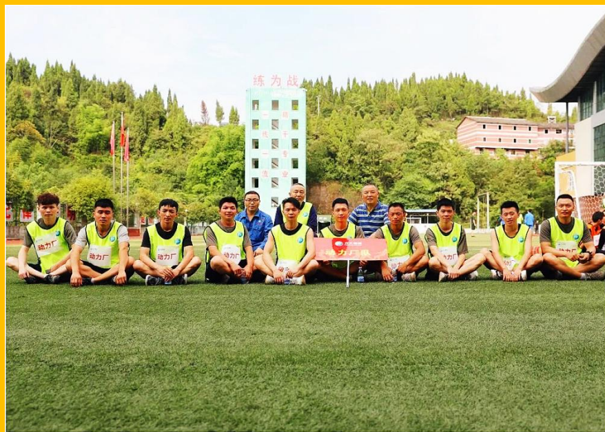
动力厂退役军人风采