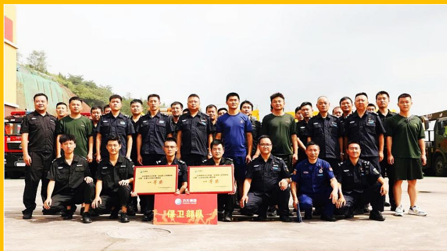
保卫部退役军人风采