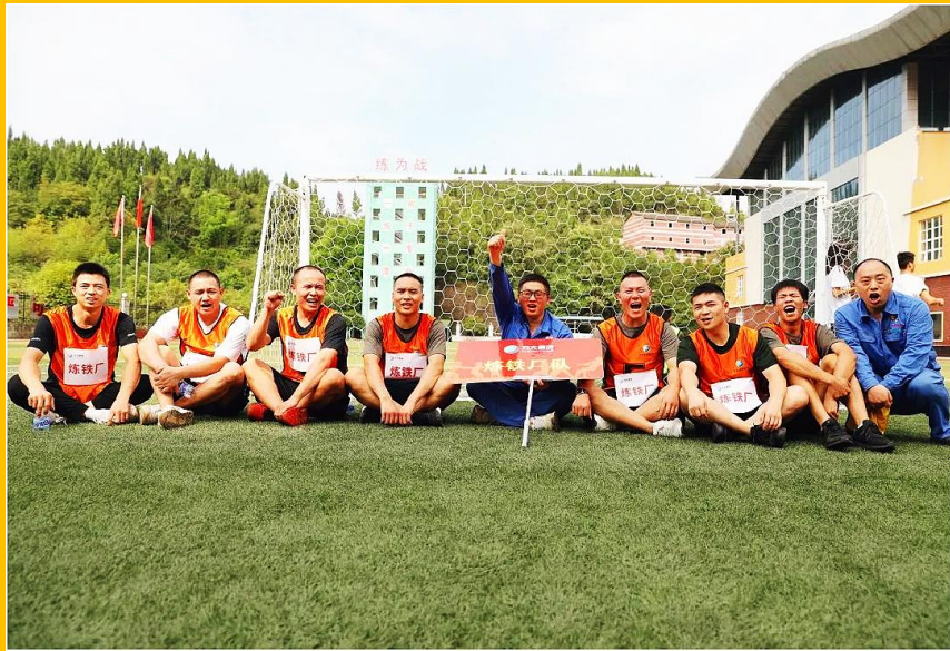
炼铁厂退役军人风采