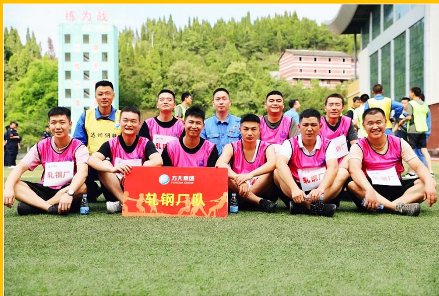
轧钢厂退役军人风采